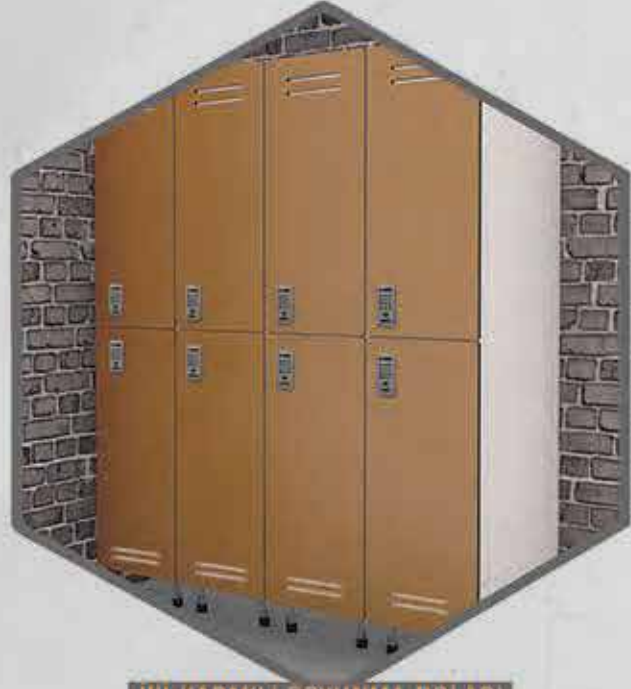
İKİ KAPAKLI SOYUNMA DOLABI