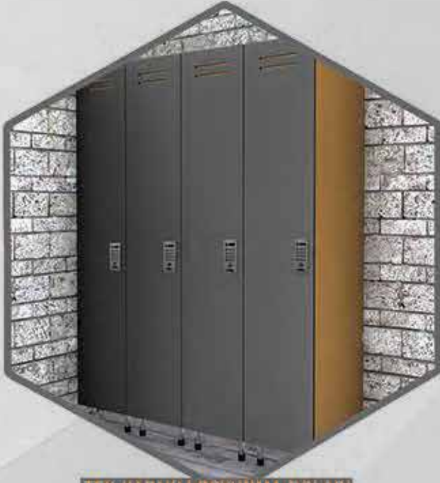
TEK KAPAKLI SOYUNMA DOLABI