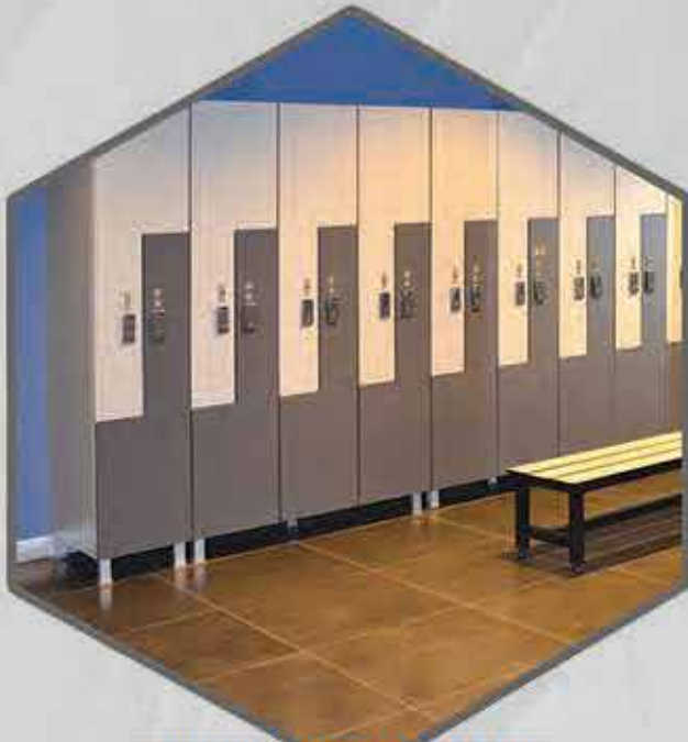
Z KAPAKLI SOYUNMA DOLABI

Aksesuar ile birlikte dolap montajında kullanılan tüm bağlantı elemanları 304 kalite paslanmaz çeliktir.